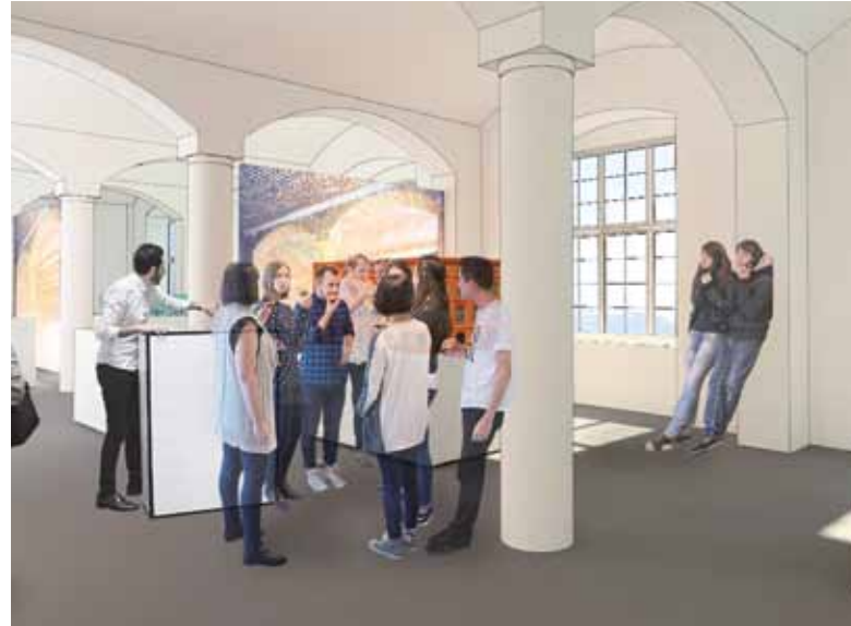
Visualisierung des Innenraums einer künftigen Bauakademie

dert später war die Bauakademie zu klein geworden. Das Haus wurde wechselnd genutzt, im Zweiten Weltkrieg schwer beschädigt, dann für die „Bauakademie der DDR“ weitgehend wiederhergestellt und dennoch 1961 dem Neubau des DDR-Außenministeriums geopfert. Der freilich hielt nur gute drei Jahrzehnte. Seitdem stehen die Bauakademie und ihre Wiedererrichtung in der Diskussion.